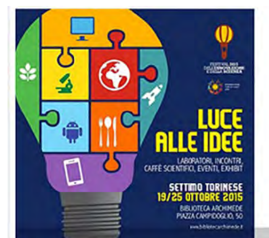
A Settimo Torinese la terza edizione del Festival dell'Innovazione e della Scienza