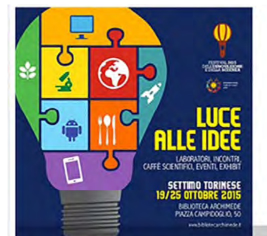
A Settimo Torinese la terza edizione del Festival dell'Innovazione e della Scienza