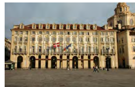
Palazzo della Giunta Regionale Piazza Castello 165 10121 Torino

Tel. 011 4321308 piemontenews@regione.piemonte.it