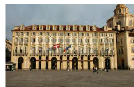
Palazzo della Giunta Regionale Piazza Castello 165 10121 Torino

Tel. 011 4321308 piemontenews@regione.piemonte.it