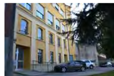
RINNOVATA SEDE ASL AT DI COSTIGLIOLE D'ASTI