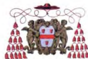
Azienda Sanitaria Locale Vercelli