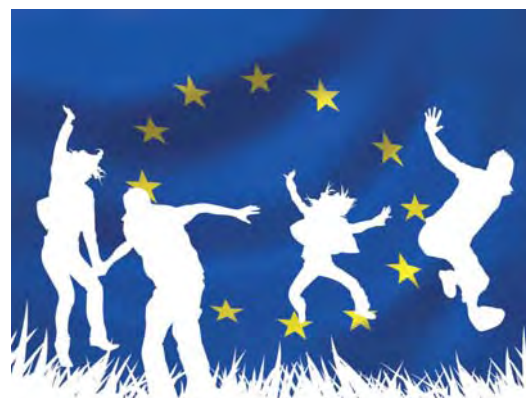
Servizio Volontario Europeo

www.provincia.biella.it/on-line/Home/articolo6530.html