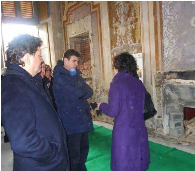
Borgo di Leri: la visita del presidente Cota