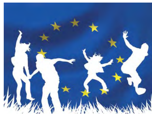
Servizio Volontario Europeo

www.aslbi.piemonte.it/upload/CE/pieghevole_mus_med_2012.pdf