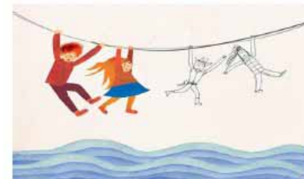
"I giovani e le nuove patologie psichiche"

option=com_content&task=view&id=120&Itemid=74