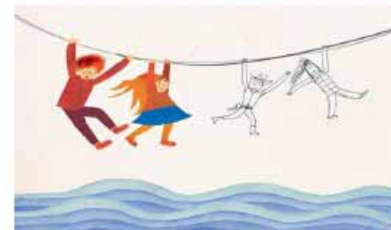
“I giovani e le nuove patologie psichiche”

www.saiga.it/index.php?option=com_content&task=view&id=120&Itemid=74