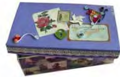
La scatola dei ricordi