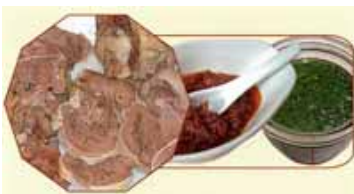
Sagra del bollito misto e bagnèt

Nell'ambito della festa patronale di San Giacomo, a Bergamasco, sabato 21 luglio si svolgerà la Sagra del bollito misto e bagnèt. Tre i locali che, dalle ore 21, serviranno il bollito, cucinato rigorosamente con carni delle macellerie locali: l'agriturismo Aamarant di regione Franchigie 17 ed i circoli Acli di via Cavallotti 39 e Aics "Da Tranquilli" di via XX settembre 13. Alle 21,30, in piazza della Repubblica, la festa proseguirà con