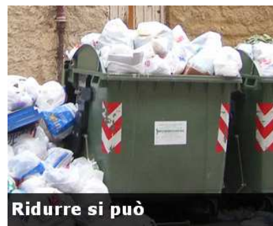
Ridurre si può