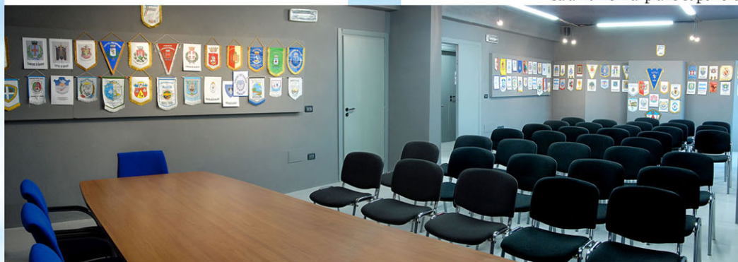
Sala riunioni al piano superiore

Per tutti gli altri, per i "disperati delle carrette del mare" che lasciano la terra d'origine, l'emigrazione è una realtà di storie tristi e di disperazione; qualcuno nel nostro Paese, in Occidente troverà la fortuna sperata, altri forse i più, una terra e una realtà difficile da accettare e molto diversa dalla propria.