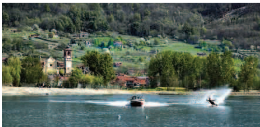
Nelle foto, Lake Palas a Palazzo Canavese, Torino

rizzazione della pista ciclo-pedonale attorno al bacino, la realizzazione di un polo di accoglienza e di promozione turistica legata alla pratica dello sci nautico presso la cascina del Mero, l'allestimento, nel rispetto dei principi di piantumazione arborea e arbustiva per il ripristino della vegetazione all'interno del circuito denominato "Percorso Natura".