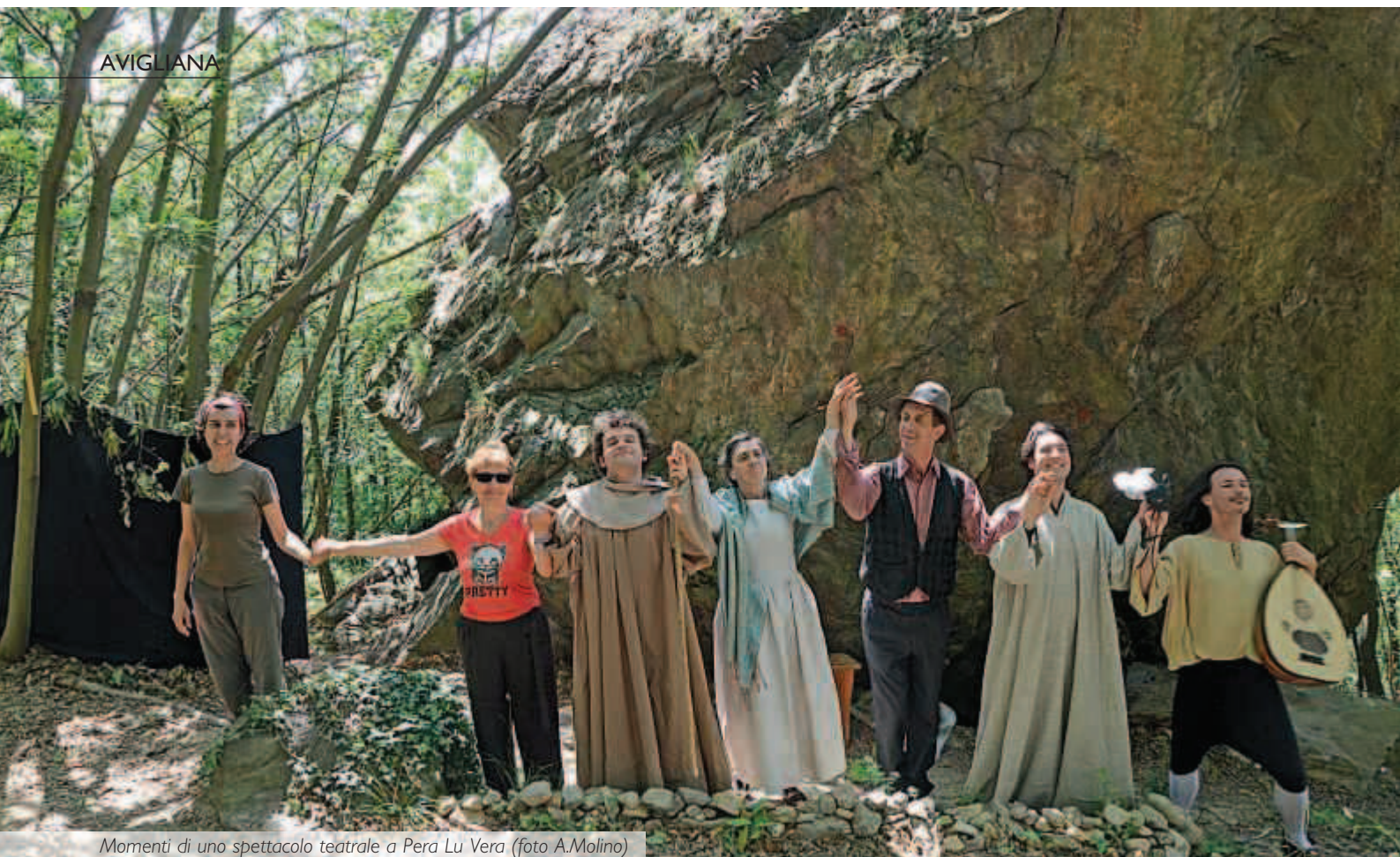
Momenti di uno spettacolo teatrale a Pera Lu Vera