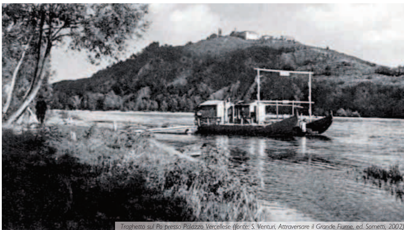
Traghettino sul Po presso Palazzo Vercellese

In questo contesto il Po, come molti altri fiumi, ha sempre rivestito un ruo-