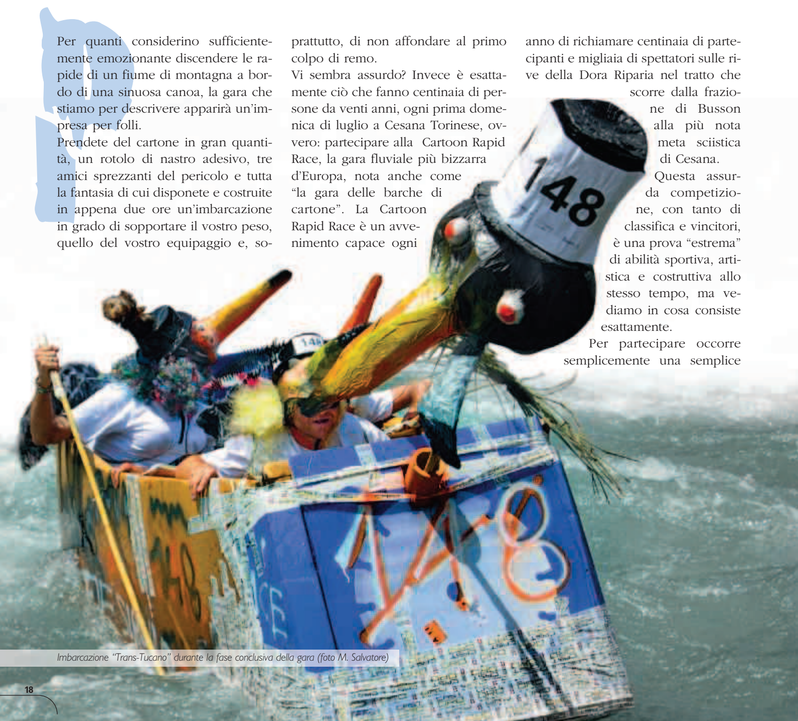
Imbarcazione "Trans-Tucano" durante la fase conclusiva della gara

Per partecipare occorre semplicemente una semplice