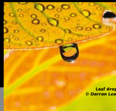
Leaf drop

Le didascalie di accompagnamento non sono certo un elemento secondario dell'evento, perché raccontano tanto i requisiti tecnici della fotografia quanto la storia e le emozioni che hanno motivato l'autore nella realizzazione dello scatto, insieme a dati di carattere scientifico sulle specie fotografate.