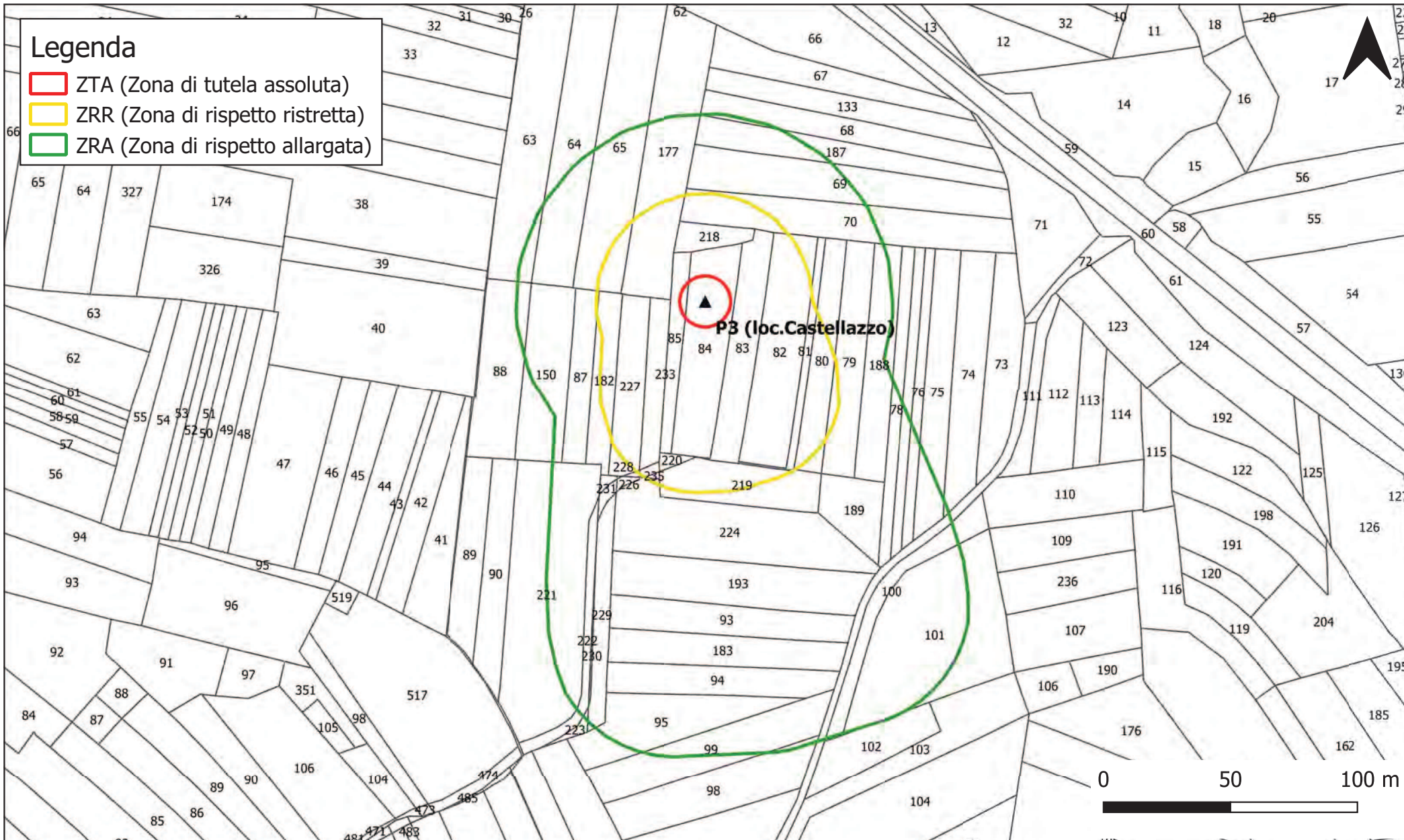
CARTA DELLE AREE DI SALVAGUARDIA - scala 1:2.000 -