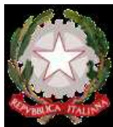
Ministero dell'agricoltura, della sovranità alimentare e delle foreste