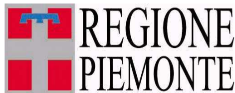
DIREZIONE AGRICOLTURA E CIBO Settore Programmazione e coordinamento dello sviluppo rurale e agricoltura sostenibile