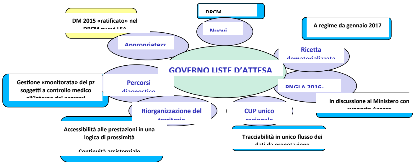
Figura 1. Fattori di contesto che rilevano nella gestione delle liste di attesa per la specialistica ambulatoriale

La soluzione alle criticità nella gestione delle liste di attesa, pertanto, non può essere meramente quantitativa sul versante dell'organizzazione dell'offerta e dei volumi della produzione, ma deve coniugare il bisogno espresso con adeguate strategie di governo della domanda che tenga conto della applicazione di rigorosi criteri sia di appropriatezza, sia di priorità delle prestazioni.