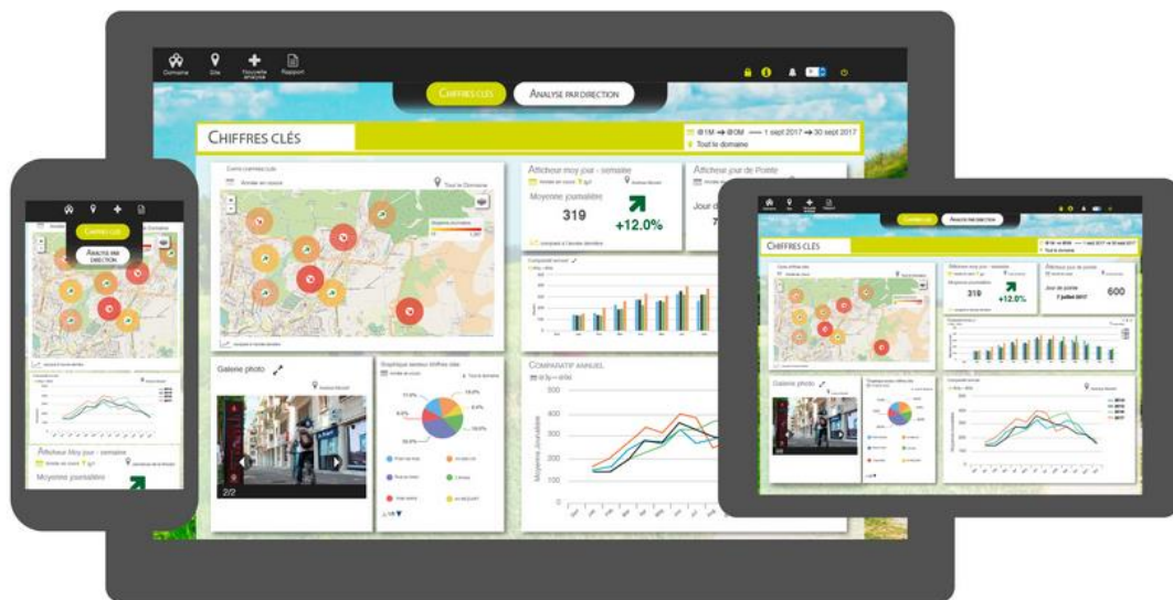
Figura 2 – Esempio di cruscotto web/mobile per la consultazione dei dati