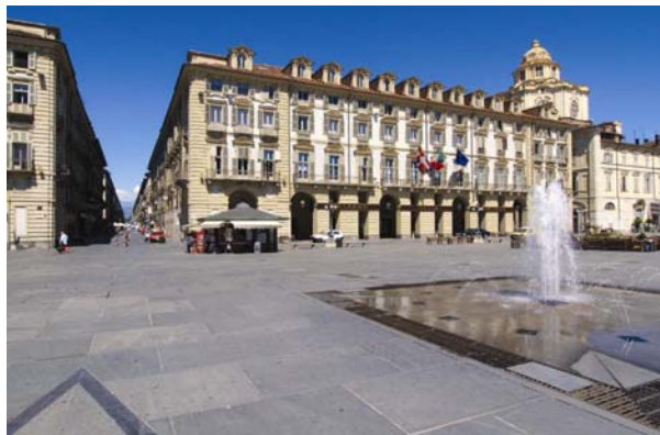
Palazzo della Regione