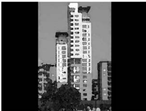
Intervento di Edilizia Residenziale Pubblica finanziato in Torino