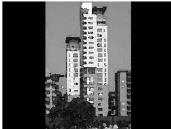
Intervento di Edilizia Residenziale Pubblica finanziato in Torino