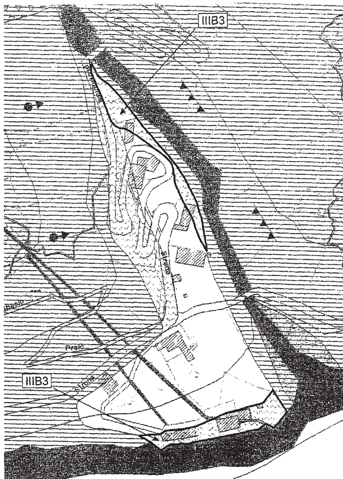
Fig. 2 - Estratto da G9a "Carta di sintesi delle pericolosità geomorfologica e dell'idoneità all'utilizzazione urbanistica", in scala 1:2.000. Sono individuati i perimetri delle aree da ascrivere alla classe III B3 in luogo della classe III B2.