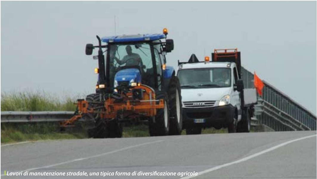
Lavori di manutenzione stradale, una tipica forma di diversificazione agricola

naturali. Deve però impegnarsi alla loro gestione per almeno 10 anni.