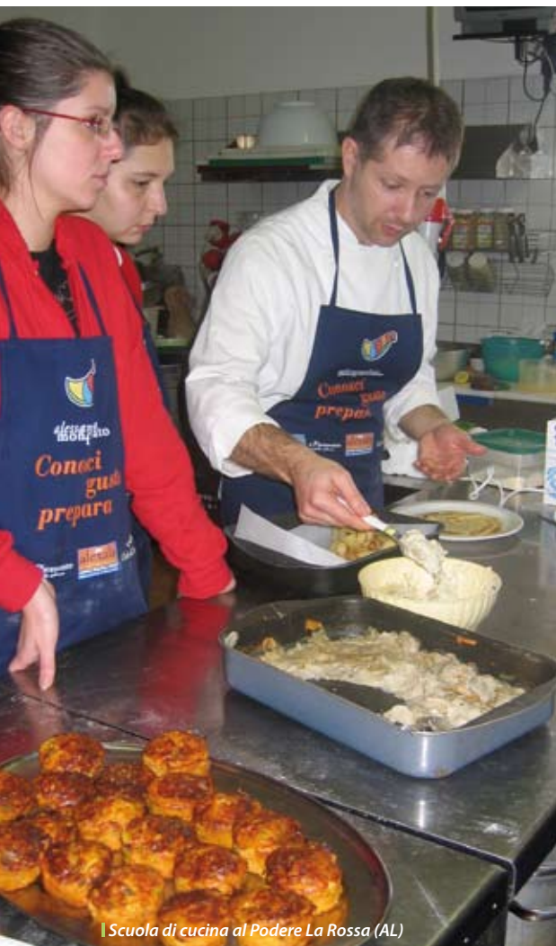
Scuola di cucina al Podere La Rossa (AL)

delle organizzazioni professionali agricole e delle centrali cooperative. È la Carta degli impegni e della qualità per le fattorie didattiche. In pratica gli agricoltori si impegnano a rispettare livelli minimi di qualità e professionalità nella loro struttura.