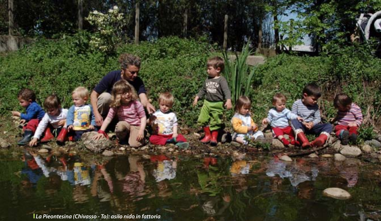
La Pieontesina (Chivasso - To): asilo nido in fattoria

Ci sono invece attività, come la cura dei bambini o degli anziani, che possono ottenere un pagamento diretto da parte dei genitori o dei parenti. Per questi servizi, oltre alla carenza dell'offerta pubblica, gioca l'attrattiva che l'ambito rurale può esercitare. Alcuni genitori sono disposti a fare 30 km in auto tutte le mattine per portare il figlio in un asilo realizzato dentro un'azienda agricola. In questo caso non è il bisogno a spingerli, quanto la convinzione che un asilo con queste caratteristiche offra qualcosa in più.