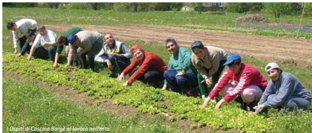
Ospiti di Cascina Bargè al lavoro nell'orto

Dunque, quella dei ragazzi di cascina Bargè non è soltanto un'attività inventata per passare il tempo. Ha uno scopo – fare raccolto – e una destinazione. "Esattamente. L'aspetto educativo è principalmente questo: i ragazzi lavorano, producono e ottengono