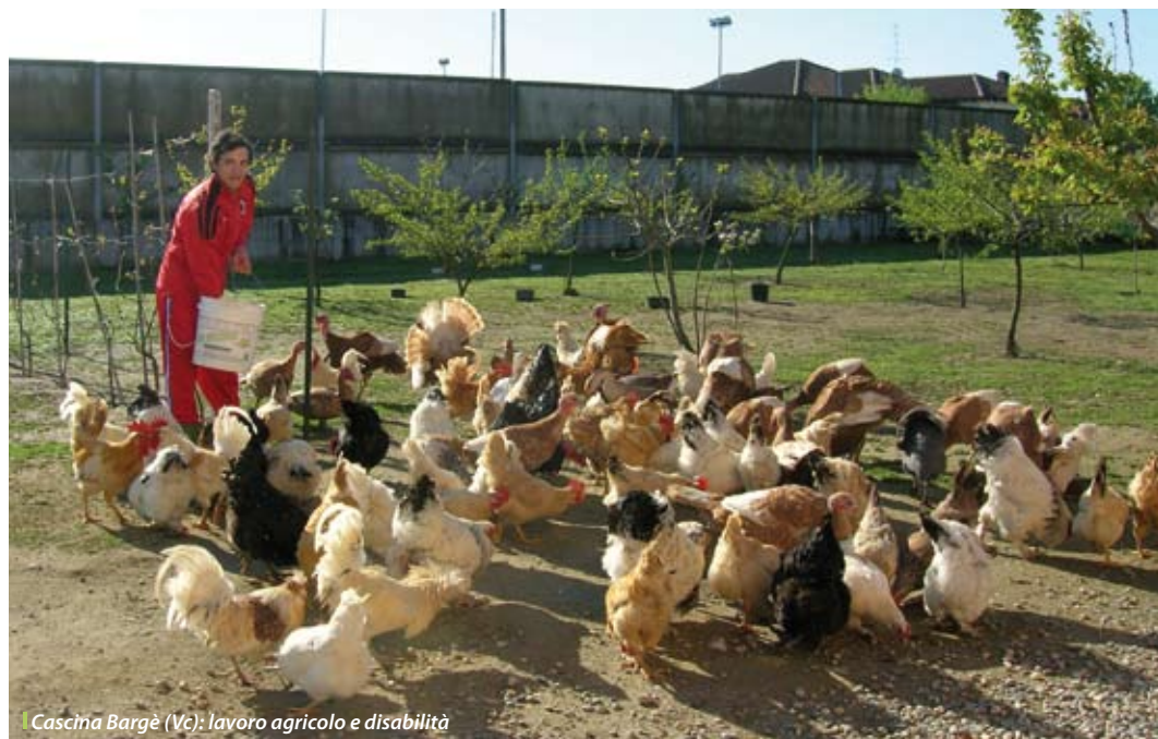
Cascina Bargè (Vc): lavoro agricolo e disabilità

Avevamo però parlato di due ragioni che giustificano il recupero di questo modello sociale. La seconda è il percorso terapeutico che esso può offrire. Una testimonianza diretta ci arriva da una delle prime realtà di questo tipo in Piemonte: un caso particolare, gestito da un ente locale, ma comunque significativo. È il Centro socio educativo Cascina Bargè di Vercelli. Lo racconteremo dettagliatamente nelle prossime pagine; qui anticipiamo che la terapia della disabilità psichica attraverso il lavoro agricolo ha dato ottimi risultati in materia di assunzione di responsabilità, educazione al rispetto del ruolo e al lavoro di gruppo, finalizzazione dell'attività, crescita dell'autostima. Risultati resi possibili – sostengono gli operatori del